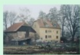
Die Mühlenwanderung führt durch ein wunderschönes Gebiet im für die ehemalige Wasserkraft in einem Waldgebiet.

Der Verein für Geschichte und Heimatkunde Oberursel und die BUND haben mit Unterstützung der Fachverwaltung der Mühlenwanderung am Urwald geschaffen. Die Besucher werden auf die lokale historische Bedeutung der Wasserkraft und die Natur an und in diesem Gebiet hin. Wir wollen Ihnen aus unserer Arbeit am Mühlenwanderweg berichten.