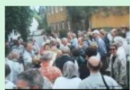
Die bei einer Führung am Mühlenwanderweg 2008