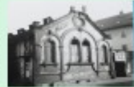
Aus der Vorfälle-Sammlung