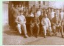
Aus der Vorfälle-Sammlung