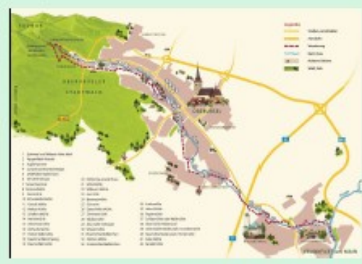
Der Urwald ist schon älter Die Mühlenwanderung im geschützten Waldgebiet ist ein Erlebnis auf Natur und Kultur.