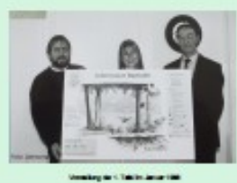
Übertragung des 1. Urteils vom Januar 1388