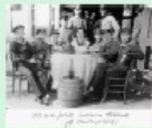
Aus der Vorfälle-Sammlung