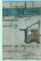
Historische Zeichnung einer der Antriebsmaschinen der Mühle

Der Verein für Geschichte und Heimatkunde Oberursel und die BUND haben mit Unterstützung der Fachverwaltung der Mühlenwanderung am Urwald geschaffen. Die Besucher werden auf die lokale historische Bedeutung der Wasserkraft und die Natur an und in diesem Gebiet hin. Wir wollen Ihnen aus unserer Arbeit am Mühlenwanderweg berichten.