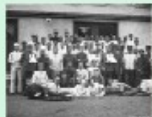
Aus der Vorfälle-Sammlung