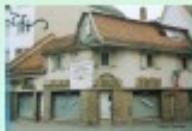
Aus der Vorfälle-Sammlung