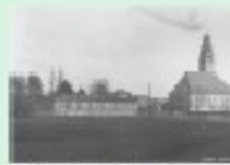
Aus der Vorfälle-Sammlung