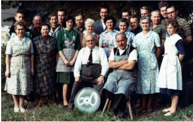
Teile der Belegschaft 1964