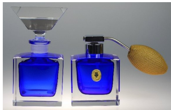
Flakons handgeschliffen mit farbigem Überfang; Design: Franz Burkert