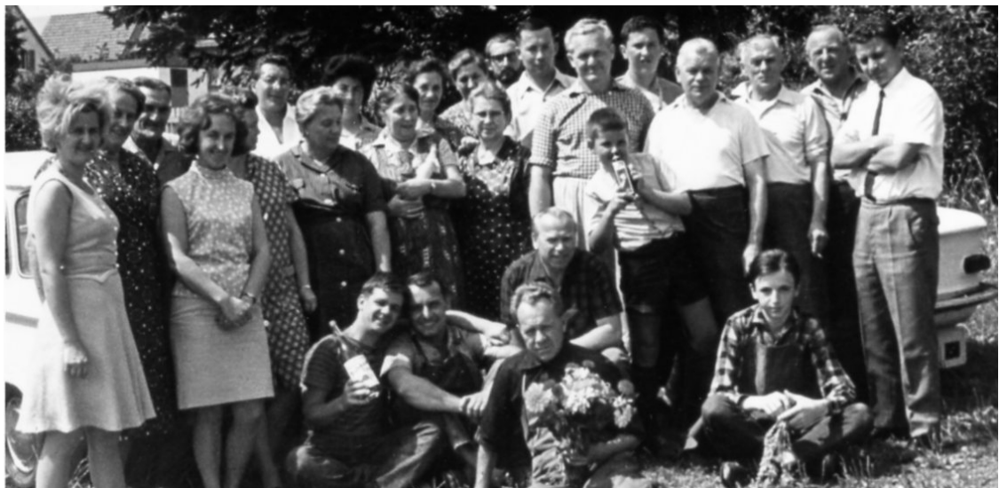
Teile der Belegschaft um 1966, Foto: Franz Burkert