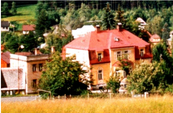
Ehemalige Schleiferei und Villa Seibt in Unter Maxdorf