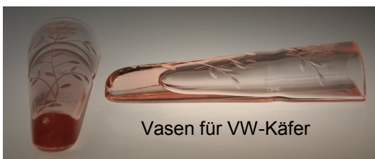
Vasen für VW-Käfer