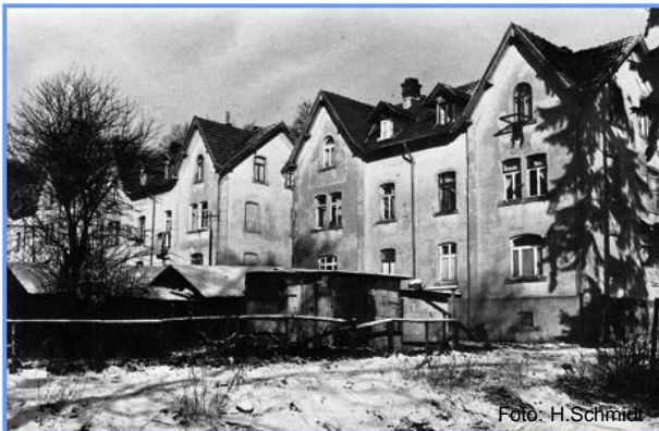
Werkseigene Wohnungen 1865