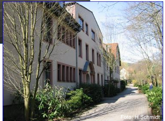
Ehemalige zweiklassige Hohemark- Schule