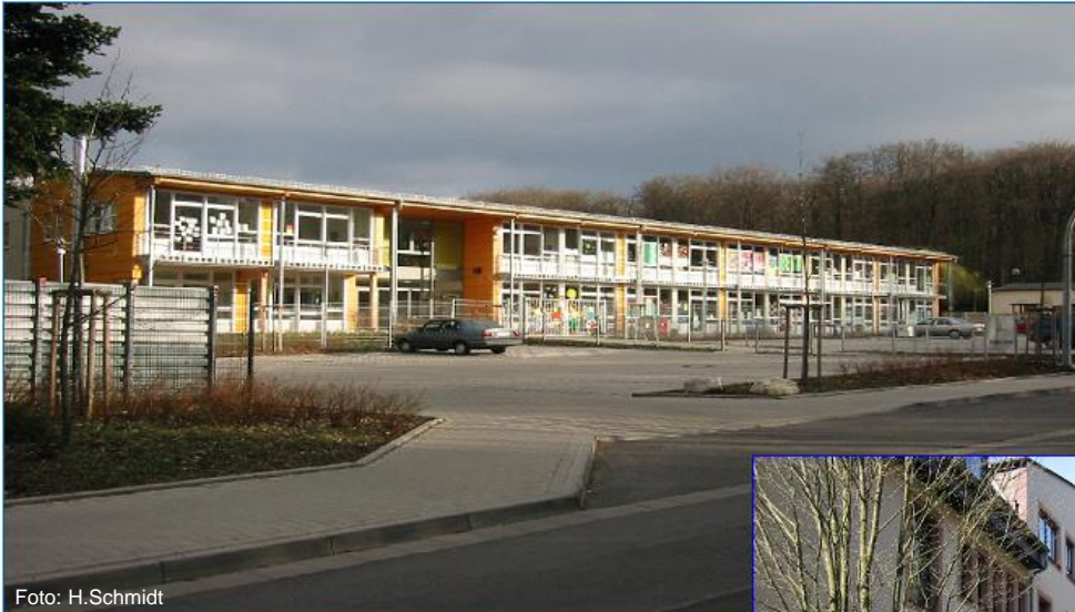
Frankfurt International School Grammar School