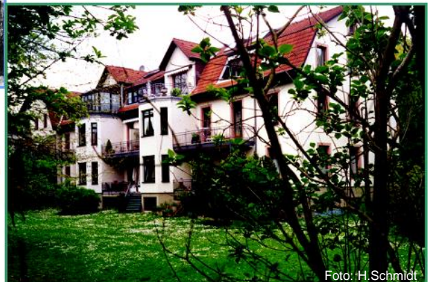
Eigentums- Wohnungen 2003